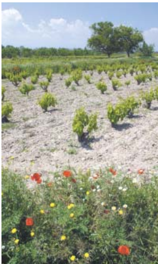
Viñedos en Albeta

Es el momento ya de pasar de las palabras a los hechos y asumir nuestras responsabilidades en el desarrollo de la Comarca del Campo de Borja. Estoy convencido que con el trabajo y la ilusión de todos seremos capaces de hacer de la nuestra una Comarca solidaria y puntera en Aragón.