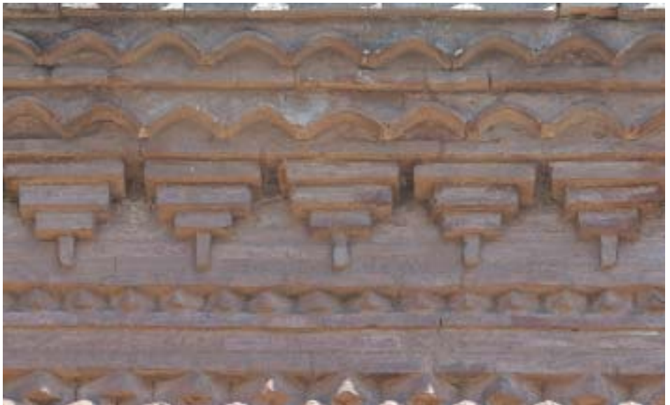
Alero mudéjar de la parroquia de Tabuena

En las páginas que siguen se va a encontrar lo que aquí se ha apuntado, si bien de una forma exhaustiva, rigurosa y amena. Casi dos centenares de fotografías a color ilustran unas páginas plagadas de datos y reflexiones debidas a un nutrido grupo de estudiosos estrechamente vinculados a la comarca del Campo de Borja. Es éste un trabajo colectivo que ha llevado más de un año realizar; en él se ha querido plasmar de forma lineal e hilvanada la realidad de nuestra comarca, ensamblando el medio físico y la naturaleza con el pasado, el futuro y la personalidad de nuestros ciudadanos, para aportar un pequeño paso más a la consolidación del espíritu