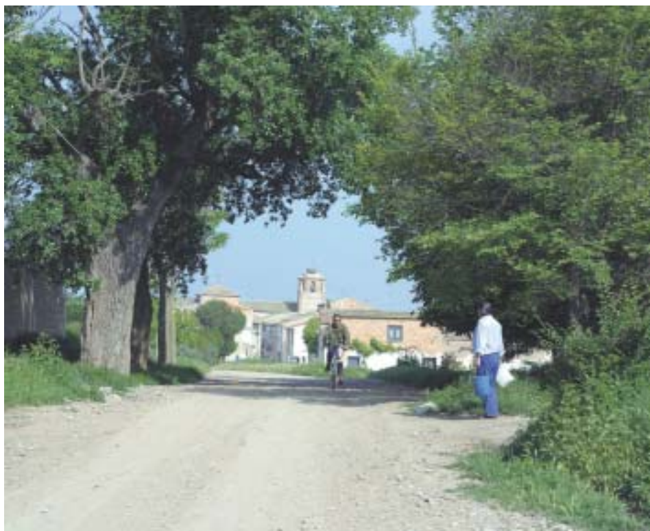
Fijar población es uno de los principales retos de la comarca

Evidentemente, todo esto ha de estar presidido por un exquisito cuidado y respeto a nuestro medio ambiente, un elemento imprescindible no sólo para conseguir el elevado nivel de vida que ansiamos, sino como factor básico de progreso y riqueza.