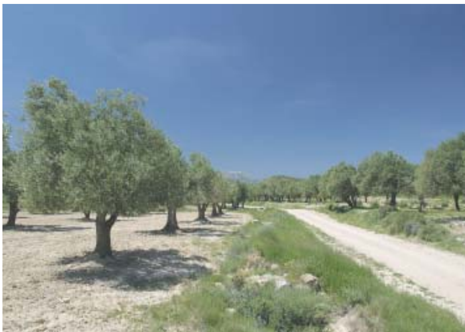
El olivar, cada vez más reducido, es signo de identidad comarcal

presenta como un producto adicional a explotar mediante una adecuada comercialización. Los polígonos industriales de Mallén/Bisimbre (N-232) Magallón y Borja (N-122) ofrecen tres polos complementarios para la instalación del sector fabril, si bien la mejora de la conexión con la autovía de Madrid –a través de la tantas veces demandada reforma de la carretera Magallón-La Almunia (A-121)– ha de ser una cuestión primordial para el desarrollo económico de la comarca. Es precisamente el estado y diseño de la red de comunicaciones el segundo de los problemas en importancia para los comarcanos, sólo detrás de la atención sanitaria.