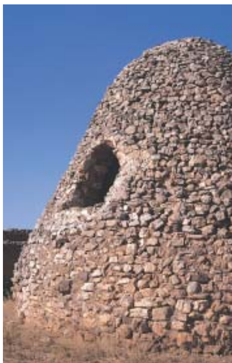
Cabaña pastoril en Pozuelo de Aragón