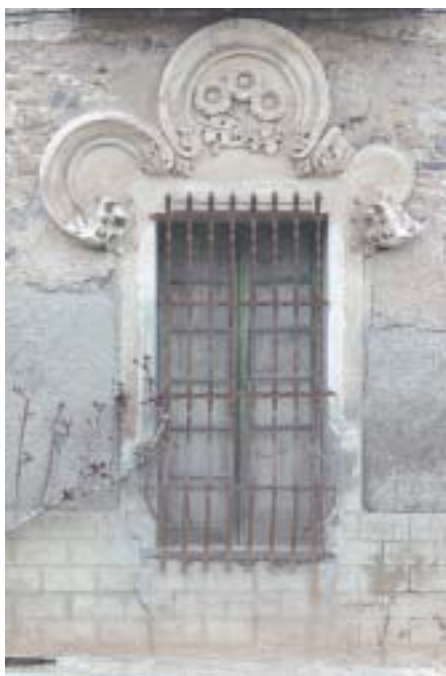
Ventana con decoración modernista. Bulbunte

Como coordinadores no queremos terminar esta introducción sin expresar nuestro agradecimiento a todos los que, de un modo u otro, han contribuido a que esta obra haya llegado a buen puerto: a los autores de los diversos capítulos, que han tenido que soportar esperas, prisas, nuevas esperas, peticiones a deshora, correcciones, resúmenes y toda suerte de vicisitudes propias de una obra colectiva y politemática como ésta; a las instituciones comarcales (ayuntamientos, parroquias, colectivos culturales y sociales) que nos han puesto todas las facilidades que ha sido menester; y en especial al Centro de Estudios Borjanos de la Institución Fernando “el Católico”, no sólo por la altruista cesión de información y materiales gráficos de sus archivos, sino porque durante todos estos años ha sido el garante y la referencia de la Cultura en el Campo de Borja. Sin el trabajo de todos ellos, a buen seguro, este volumen no habría sido como es.