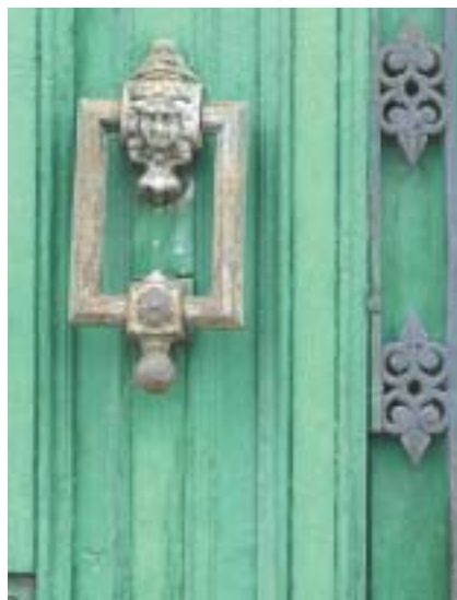
Detalle de una puerta, Bulbuentte

La situación de los municipios de nuestra comarca, integrantes de un territorio fronterizo de Aragón con Castilla-León y con Navarra, enmarcados por el Ebro al norte y las sierras del Sistema Ibérico al sur, ha forjado una identidad integradora como hay pocas en el resto de nuestra Comunidad Autónoma. Como es lógico pensar, en un entorno natural como éste no puede haber una unidad paisajística que aglutine a esta comarca: es un territorio forjado por la historia y las relaciones humanas por encima de otras coyunturas.