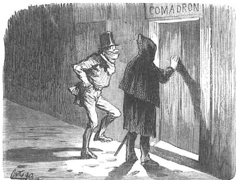
Llame usted fuerte, que las tres han dado y estamos de muchísimo cuidado!