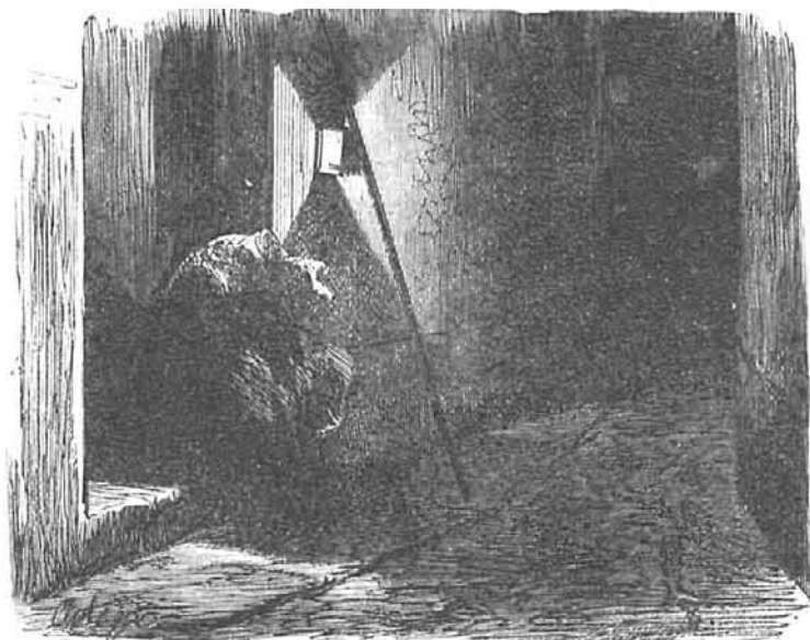
¡La una de la noche! Que hora esta para el que gusta de dormir la siesta!

DIME LO QUE EN LAS CALLES DE MADRID VES, Y TE DIRE LA HORA QUE ES.