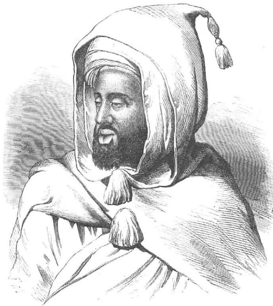
SIDI-MAHOMET, SULTAN ACTUAL DE MARRUECOS.

Cuando el tiempo, ese sublime anciano, como decian los antiguos filósofos, parecia