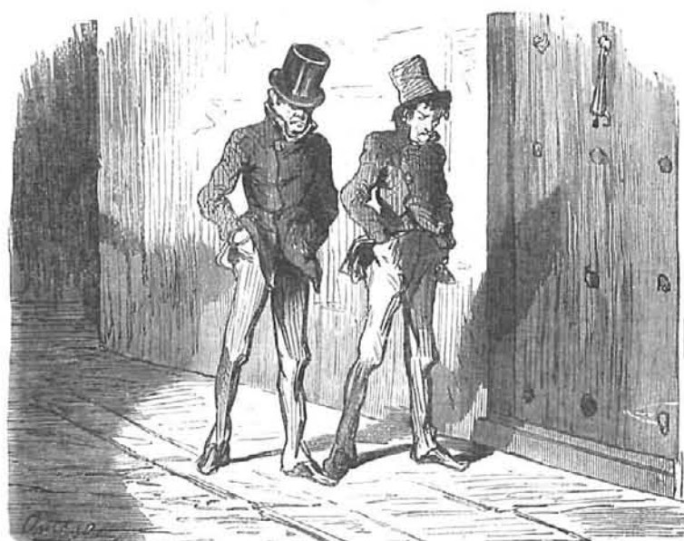
—Chico, las cuatro son de la mañana. —Y de acostarse ya, ¿quien tiene gana?

En las pilastras y sobre los arcos que cierran el patio, se leen estas otras composiciones aisladas.